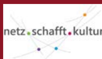
Netz schafft Kultur