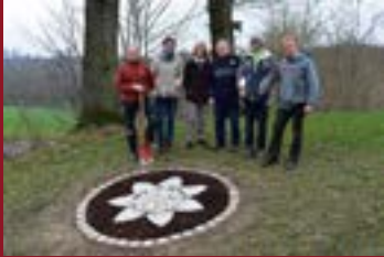
Dankeschön an alle Ehrenamtlichen