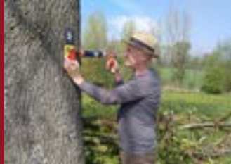
Markierungen an Wanderwegen