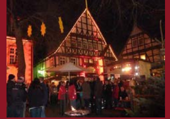
Sternenmarkt in Beverungen