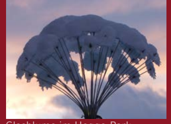
Glasblume im Hegge-Park

Zur Aufführung kommen neben Werken der französischen Musik aus der Romantik, dem Impressionismus und der Moderne auch weihnachtliche Klänge keltischen, französischen und amerikanischen Ursprungs.