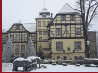
St. Hubertus Heerse