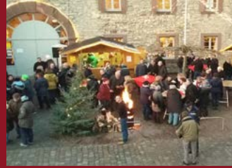
Nikolausmarkt in Ottbergen