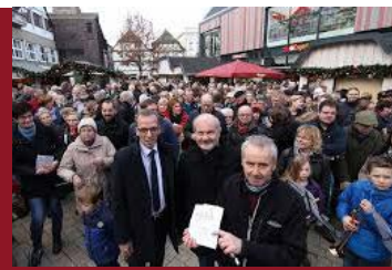
Weihnachtssingen in Höxter