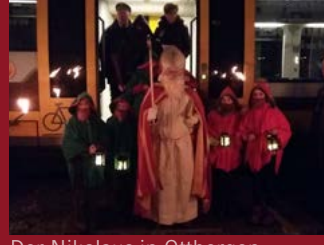
Der Nikolaus in Ottbergen