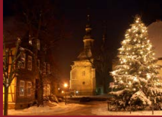
Adventsstimmung in Willebadessen