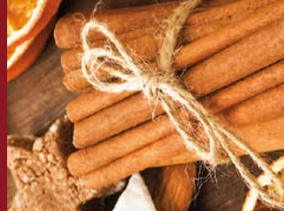
Adventsmarkt Bad Driburg